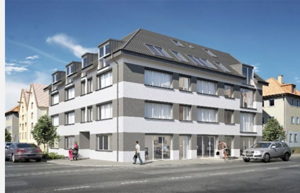
S.-VAIHINGEN / WOHN- +GESCHÄFTSHAUS