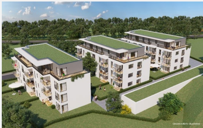
MURRHARDT | 33 WOHN EINHEITEN