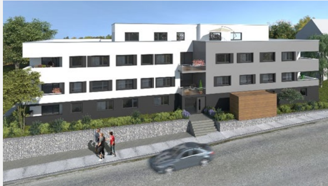
WALDENBUCH / 18 WOHN EINHEITEN

Die grafischen Darstellungen dienen dazu, Ihnen unser Projekt verständlich darzulegen. Diese Darstellungsform wird von gestalterischen Gesichtspunkten geprägt und erhebt deshalb keinen Anspruch auf absolute Detailtreue. Bitte entnehmen Sie die genauen Details und Maße den Architektenplänen. Die Möblierung in den Grundrissgestaltungen stellt lediglich einen Einrichtungsvorschlag dar und ist nicht im Angebot enthalten. Darüber hinaus können die Darstellungen teilweise aufpreispflichtige Sonderwünsche enthalten. Die Größen der Terrassen, Balkone und Loggien fließen zur Hälfte in die Wohnfläche mit ein. Flächenangaben sind Circa-Angaben.