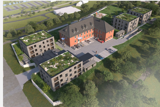
Horb a. Neckar | 34 WOHN EINHEITEN